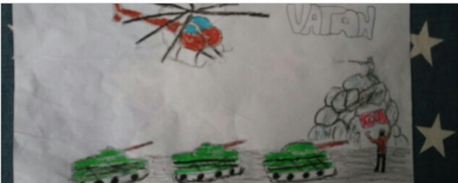
Seydi ŞAHİN 8/B